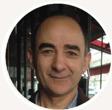
Pr Hassan El Ghomari